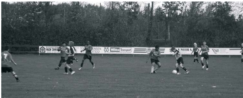
Lilleputterne har hørt efter til træning

Inden jeg overhovedet begynder at skrive noget om drengene og klubben, vil jeg takke SAMTLIGE SPONSORER for den helt enorme og overvældende støtte, der er blevet os vist. Mit hjerte voksede og blev alfavnende (t bevidst udeladt) som himmelrummet, efterhånden som I gav tilsagn om at støtte lilleputterne i FC King George, så en STOR tak til Jer ALLE.