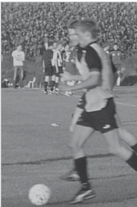
FC King George gjorde rent bord i foråret.

Det tegner dermed godt for resten af sæsonen, hvor flere spillere vender tilbage til holdet efter endt praktikophold, ligesom det tyder på en spillertilgang eller to, så hvis den gode moral og den flotte fight fortsætter, er FC King George godt på vej tilbage mod Serie 3.